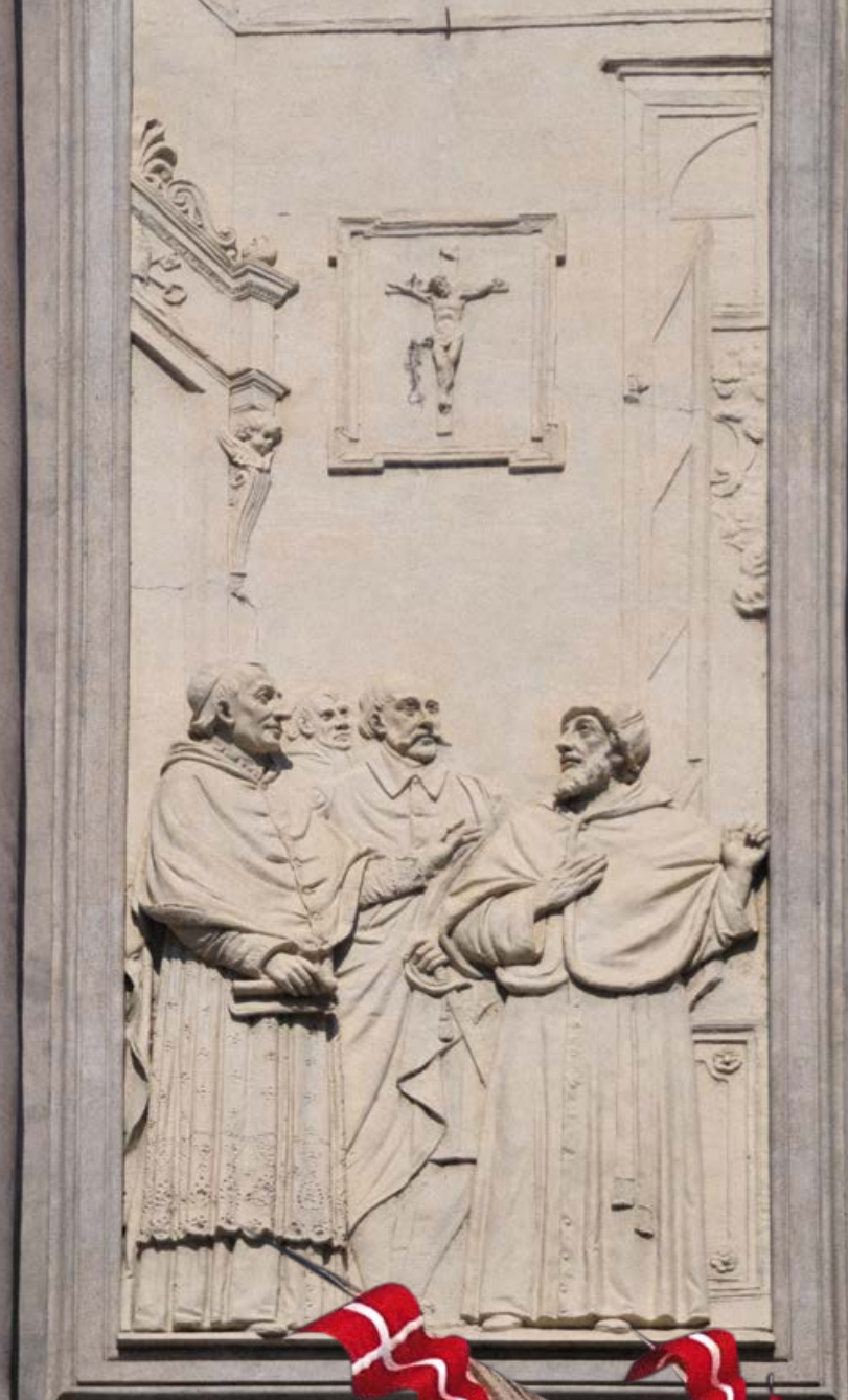
Nella facciata esterna della basilica di Maria Ausiliatrice, questo bassorilievo coglie il momento in cui il santo papa piemontese Pio V annuncia la vittoria di Lepanto. In alto: l'interno della basilica