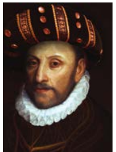
L'ammiraglio Andrea Provana di Leyni e, sotto, il papa Pio V. Nel dipinto: un particolare dell'affresco che decora la cupola di Maria Ausiliatrice. Sotto: la presunta bandiera di Lepanto nella chiesa di San Domenico