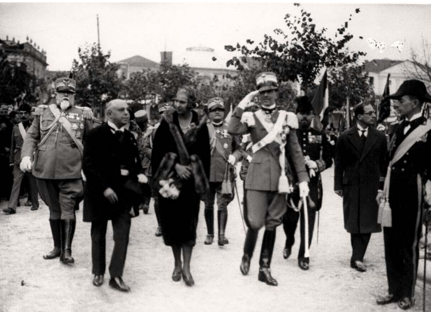
Umberto e Maria José, Principi di Piemonte, in una immagine torinese dei primi anni Trenta

Con Maria José. Il matrimonio fra Umberto e Maria José fu celebrato a Roma l'8 gennaio 1930; la coppia venne successivamente ricevuta da Pio XI. L'arrivo dei Principi di Piemonte a Torino avvenne il 2 febbraio 1930. La Stampa dedicò all'avvenimento l'intera prima pagina dell'edizione del 3 febbraio, un mastodontico 7 colonne a tutta pagina (e buona parte della pagina successiva). Nemmeno dosando con il nostro pacato buon-senso l'entusiastico tono del giornalismo di allora possiamo negare che Torino intera si riversò per strada applaudendo alla coppia di sposi. Tanta era la gioia di vedere nuovamente nella città della Mole una cerimonia dinastica, che faceva rimpiangere i tempi del glorioso passato da capitale.