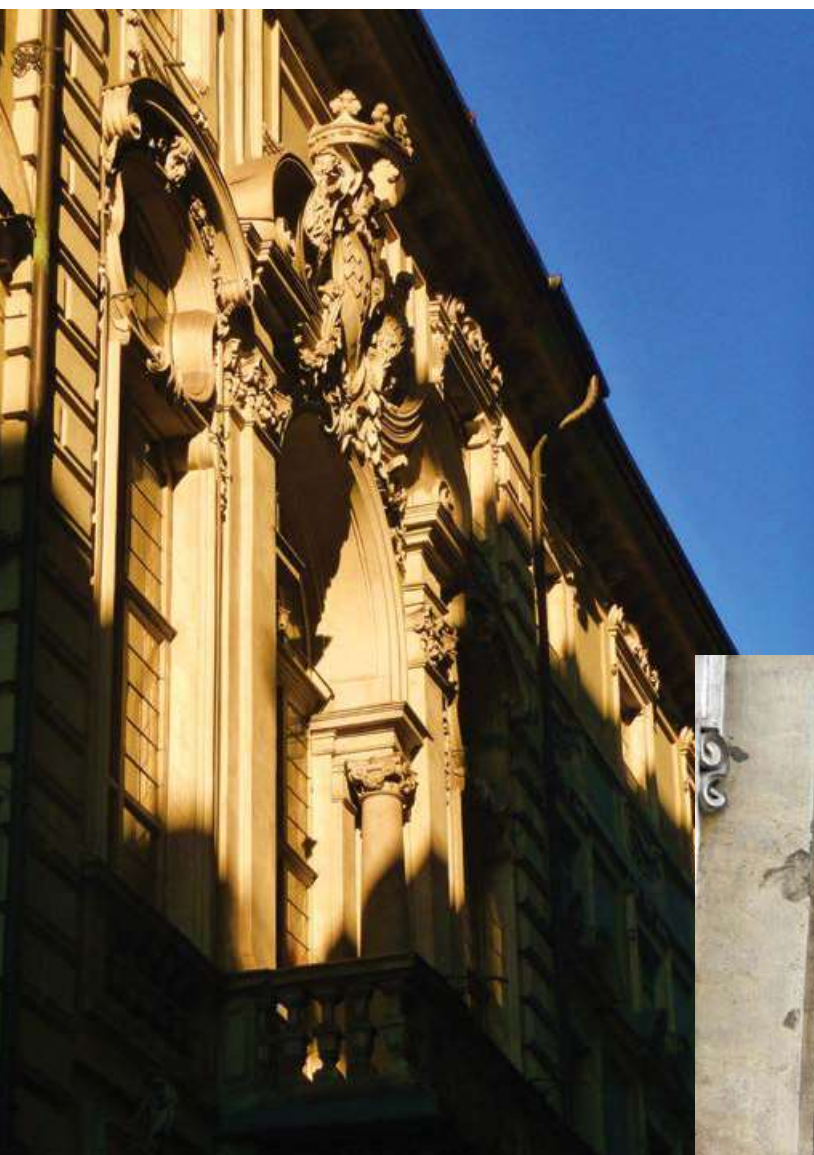
La facciata di Palazzo Barolo in via delle Orfane 7 con la lapide che ricorda Silvio Pellico

Pellico in carcere, i Marchesi Giulia e Tancredi di Barolo, la lapide che ricorda Le mie prigioni sulla facciata del palazzo di via Barbaroux 20